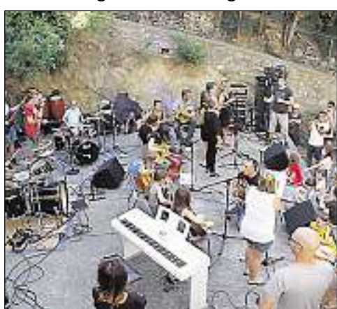
► L'école de musique de Treilles en concert. Keziah Jones sur la scène des Bulles sonores de Limoux.